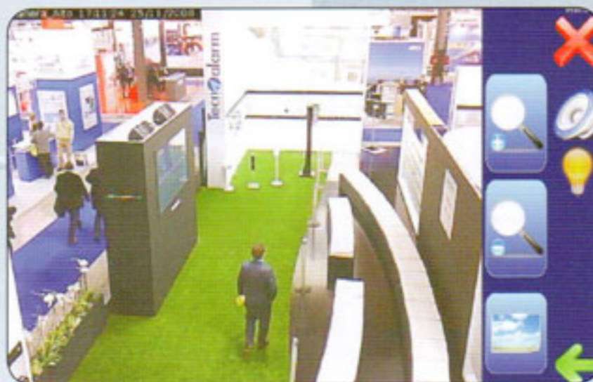
Visualizzazione di un fotogramma associato ad un allarme