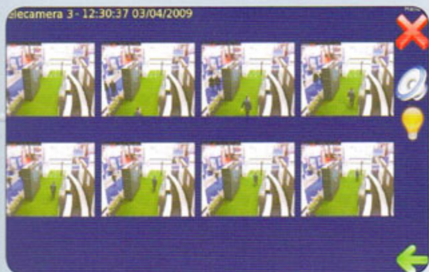
Visualizzazione della sequenza fotografica associata all'allarme